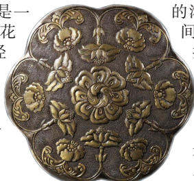
图2 晚清银鍍刻花卉纹攒盒

攒盒中蕴含着的人文,是中国千百年生活美学的浓缩,在开合之间,它优雅自生。攒盒上所描绘的吉祥纹饰和鲜艳的颜色,也为新年增添了喜庆的气氛。在它身上,烟火与山水共存。