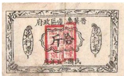
图6 晋冀鲁豫边区兑米票“拾斤”