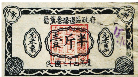
图5 晋冀鲁豫边区兑米票“壹斤半”

兑米票,是战争年代根据地保障供给、稳定物价、促进经济的一种特殊产物,为解决边区军需民用作出巨大贡献。