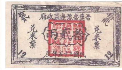
图9 晋冀鲁豫边区兑米票“拾贰两”