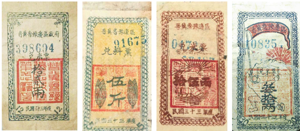
从左至右依次为:图1 晋冀鲁豫边区兑米票“拾贰两”、图2 晋冀鲁豫边区兑米票“伍斤”、图3 晋冀鲁豫边区兑米票“拾伍两”、图4 晋冀鲁豫边区兑米票“叁拾两”

兑米票大约出现于1941年初。这年1月,十八集团军(八路军)野战供给部首先发行“军两”“小米伍两”“小米壹斤”,并在粮券正面印制使用说明。在根据地内的边区政府,同年也发行了兑米票,笔者所见的一枚“小米壹百斤”的兑米票,用蓝色印油印制,兑米票背