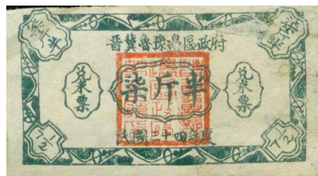
图7 晋冀鲁豫边区兑米票“七斤半”