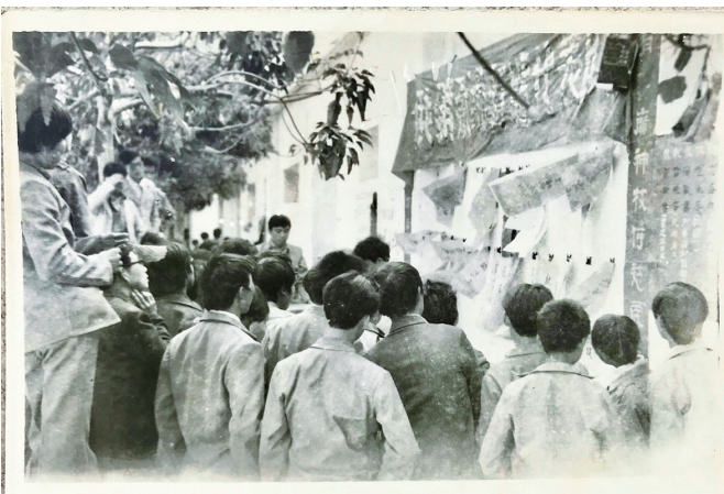
1986年东山岛县城街头的虎年新春谜会