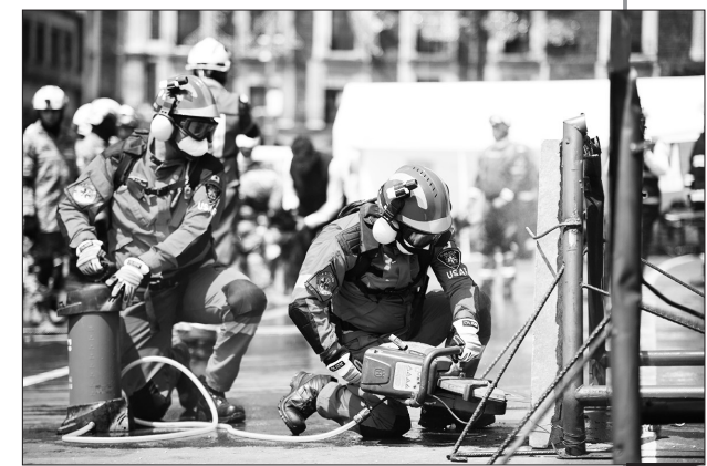
▲墨西哥举行2023年第二次全国地震演习 9月19日，救援人员在墨西哥首都墨西哥城参加地震演习。当日，墨西哥举行2023年第二次全国范围地震演习，以提升应对灾难的能力。墨西哥地处环太平洋地震带，多个板块在此交会，因此地震频发。