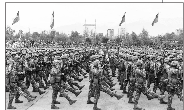
▲智利举行陆军节阅兵式 9月19日，在智利首都圣地亚哥，士兵在阅兵式上列队前进。当日，一年一度的智利陆军节阅兵式在首都圣地亚哥奥伊金斯公园举行。智利陆海空三军和警察部队7700多人参加了阅兵式。

据新华社开普敦9月19日电 南非副总统马沙蒂莱19日在开普敦表示，非洲应通过全球伙伴关系，加快建立自力更生的疫苗生产能力及大流行病防范能力。 马沙蒂莱当天在发展中国家疫苗制造商联盟第24届年会上致辞时说，在新冠疫情期间，非洲和许多地区一样，在获得足够的疫苗方面遭遇重大挑战。在一个不断演变的世界中，非洲国家不能继续依赖外部来源获得疫苗和大流行病防范能力。 马沙蒂莱说，通过由非洲疾病预防控制中心协调的非洲疫苗制造伙伴关系计划，非洲朝着实现自给自足的疫苗生产和大流行病防范迈出了大胆而果断的步伐，其目标是到2040年使非洲大陆所需疫苗总量的60%实现本土生产。 发展中国家疫苗制造商联盟第24届年会于9月19日至21日在南非开普敦举行。本届年会的主题是“通过全球伙伴关系加快可持续的地区疫苗制造”。