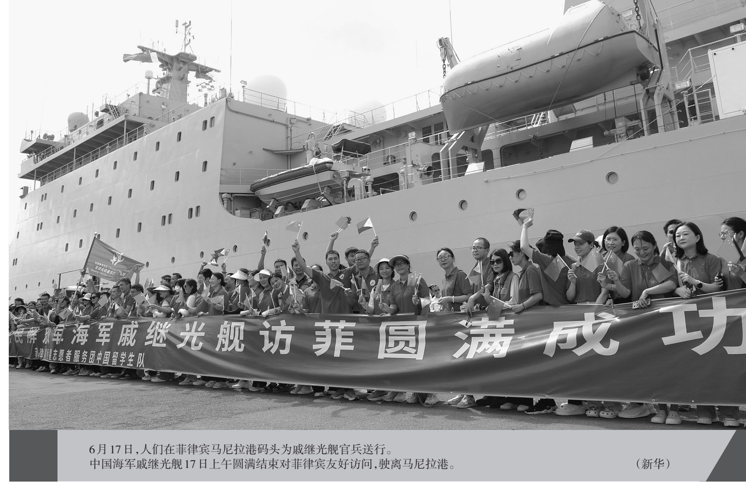
6月17日，人们在菲律宾马尼拉港码头为戚继光舰官兵送行。中国海军戚继光舰17日上午圆满结束对菲律宾友好访问，驶离马尼拉港。