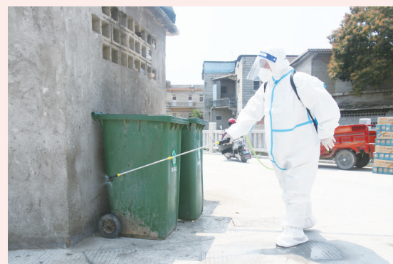
针对“四害”经常出没的地方进行药物喷洒