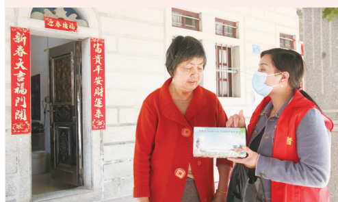
志愿者开展“爱国卫生月”宣传

记者注意到,石狮各镇、街道也积极发动志愿者队伍加入爱国卫生月宣传工作,不断营造良好的健康环境氛围,促进市民卫生健康行为养成。各镇、街道志愿者队伍抓住春季天气变暖、群众户外活动增多的时机,加强社区居民宣传发动,通过健康大讲堂、健康科普巡展等形式,传播文明健康行为、规律作息、适量运动、心态乐观、合适膳食、公筷公勺、健康自我管理健康生活方式,积极营造有益于健康的社会环境,动员市民群众走向户外,愉悦身心,促进健康。另外,志愿者还通过集中开展宣传教育和巡访劝阻行动,向群众宣传文明健康绿色环保生活方式,广泛传播“自己是健康的第一责任人”的理念,做到卫生行为讲一讲、行为陋习管一管、散落垃圾拾一拾,进一步提高群众自我保健意识和能力。