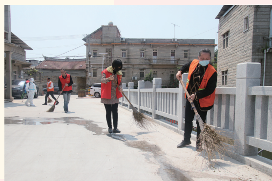
宝盖镇苏厝村党员干部开展环境卫生整治