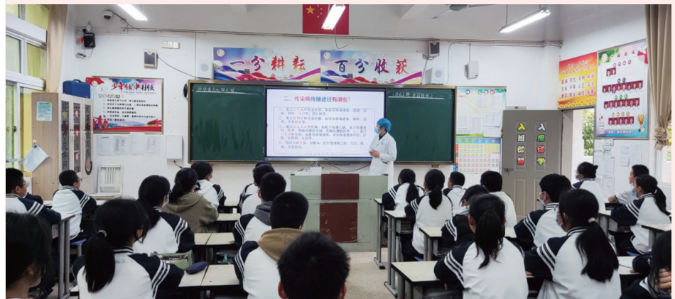
医护人员走进学校,科普传染病防控知识