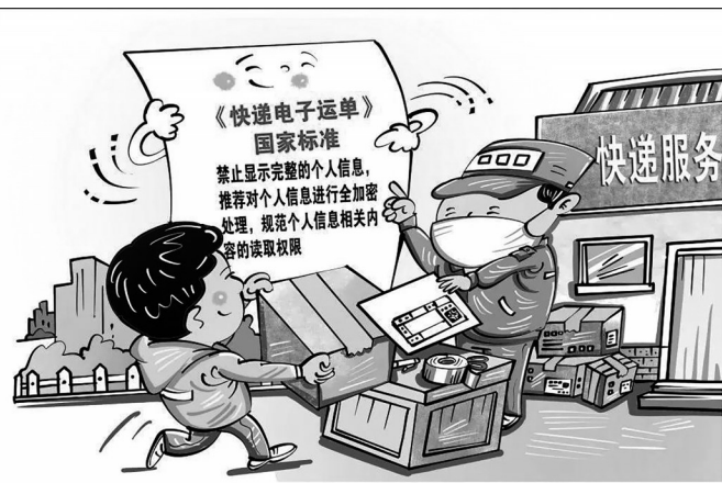
强化个人信息保护

前段时间出现了新型诈骗,有不少市民莫名其妙收到陌生快递,快递里面是一个印有二维码的杯子。这是诈骗分子通过非法渠道获取我们的个人信息,如姓名、手机号、收货地址等,并邮寄印有二维码的水杯。只要扫描了杯子上的二维码,就可能落入诈骗分子设下的圈套,引诱你下载软件、充值垫付刷单,这就是典型的“刷单诈骗”手段。警方提醒,广大市民如收到带有二维码的快递,千万不要扫。且在扔掉杯子、宣传页前,务必将杯子、宣传页上的二维码涂抹掉,避免有人捡到后被骗。这极可能是快递单上个人信息泄露,从而