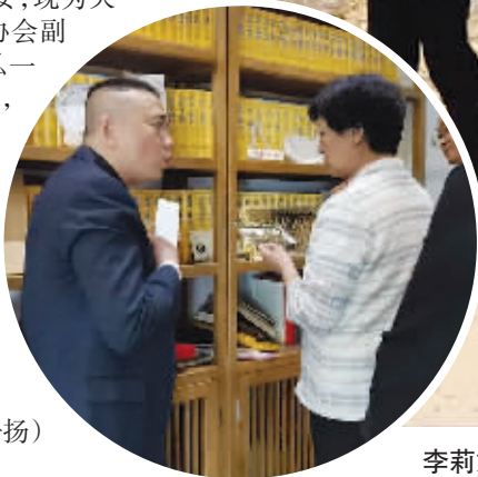
李莉娟了解与弘一大师相关的老照片