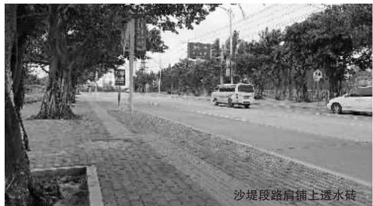
358线(西外环)的市民，稍加留心也能感受到，自顺接狮城大道的圆盘起点处开始，道路两侧原本的土路肩已硬化，路肩杂草垃圾也清理干净，仕林桥等小桥的涵洞进行了清淤修缮，公路标线也

本报讯 以交通运输部对“十三五”全国干线公路管理养护评价为抓手，2020年，石狮公路分局投入超1600万元，着力提升专养公路的技术等级和公路路况。去年，该局专养的两条国道干线公路优良率则一如既往地保持100%，年平均PQI值(公路路面使用性能指数)则达到90.6，而在“十三五”初期的2016年，这一数值为88.2。