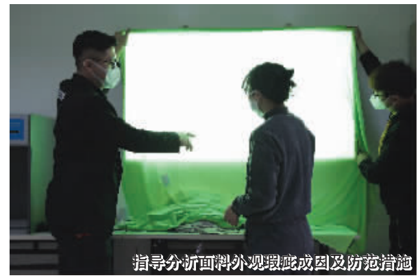
指导分析面料外观瑕疵成因及防范措施