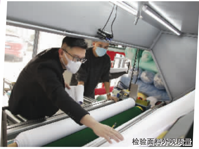
检验面料外观质量