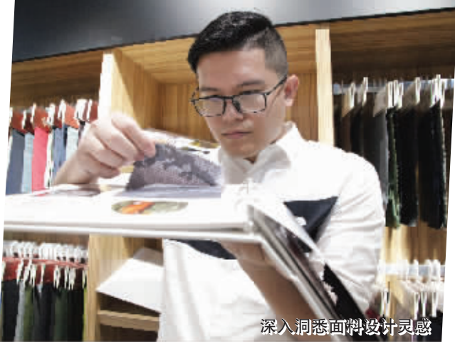
深入洞悉面料设计灵感