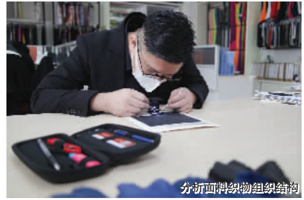
分析面料织物组织结构