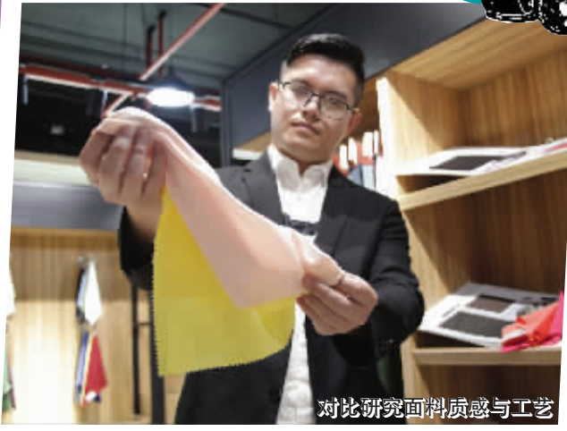
对比研究面料质感与工艺