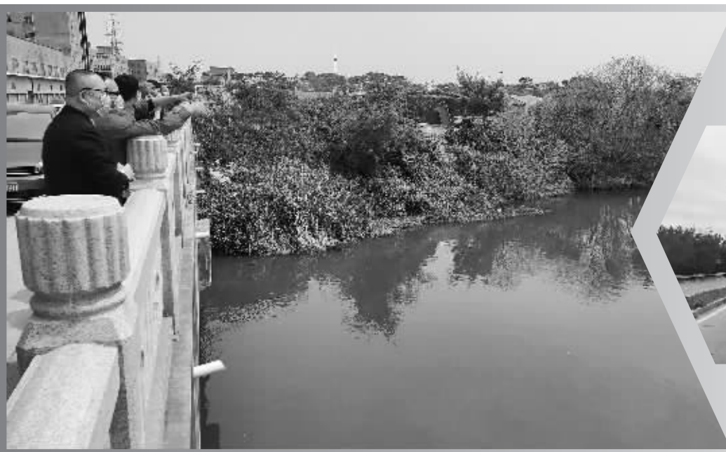
全面推进行河长制 联合执法行动 石狮市河长办 水务处 主办