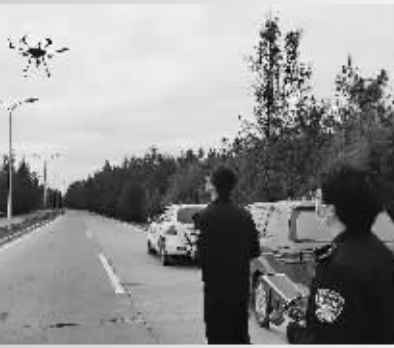
左图:执法人员巡查南低渠晋石交界河段; 上图:无人机“巡河”

“公检法河”，联合巡河！3月25日上午，石狮市公安局、市人民检察院、市法院、市河长办首次开展联合巡河行动，先后前往奈清水库（厝上溪）、大厦溪、南低渠等地现场检查，对发现的涉水涉河违法行为，形成合力、督促解决。值得一提的是，本次行动还首次采用无人机“巡河”创新模式，借助科技手段提高巡河效率，实现巡河无死角、零盲区。