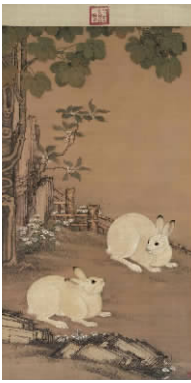
图6 清代冷枚《梧桐双兔图》

的平台阁楼上,隐约可见有人穿梭、呼喊。整个画面,没有堵塞的车水马龙,也没有喧闹的人山人海,取而代之的是远山江帆、月影银涛,一幕祥和而又没有纷扰的景致。作者以极为细腻的情感与笔触,描绘了精妙的楼阁与粼粼江涛,很好地描绘出了苏轼的诗意。