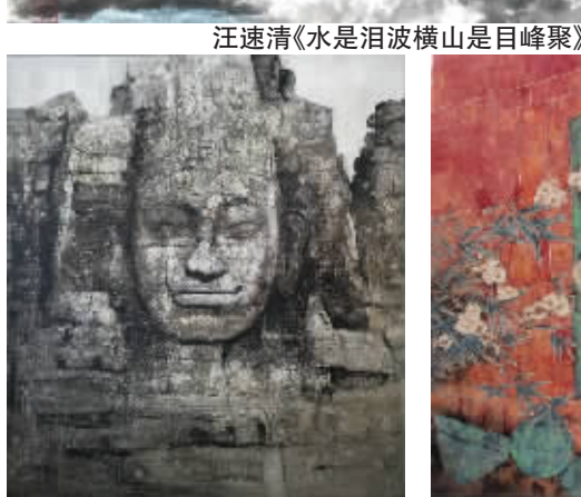
吴斌《一带一路之吴哥印象》