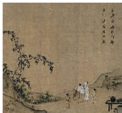
图1 马远《月下把杯图》

指缝宽,时间瘦,当天上的那轮明月由缺向圆,一年一度的中秋佳节又即将到来。对于这个寄托着中华儿女阖家团聚、幸福团圆等美好愿望的佳节,历代诗词名家皆有吟咏,流传至今的也多为人们所耳熟能详。而在传世书法之中也有不少此类佳作,如文徵明所书的《行书咏中秋》“横笛何人夜倚楼,小庭月色近中秋。凉风吹堕双桐影,遍地碧阴如水流”,林散之题写的《中秋望月》“中庭地白树栖鸦,冷露无声湿桂花。今夜月明人尽望,不知秋思在谁家”,赵朴初创作的《中秋寄家人月圆》“思亲倍是逢佳节,翘首盼归期。年年此夜,天清地爽,年年此夜,天清地爽,明月圆时。何当共赏,笙吹同调,花发连枝。愿同努力,因缘成就,兄弟怡怡”等等,品赏之余,使人顿生出无限遐想与相思之情。可以说,自古以来,中国人把对中秋佳节的美好遐想都留给了艺术创作。今天,就让我们共同欣赏古代书画名家笔下的中秋赏月之作。