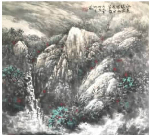
汪速清《水是泪波横山是目峰聚》