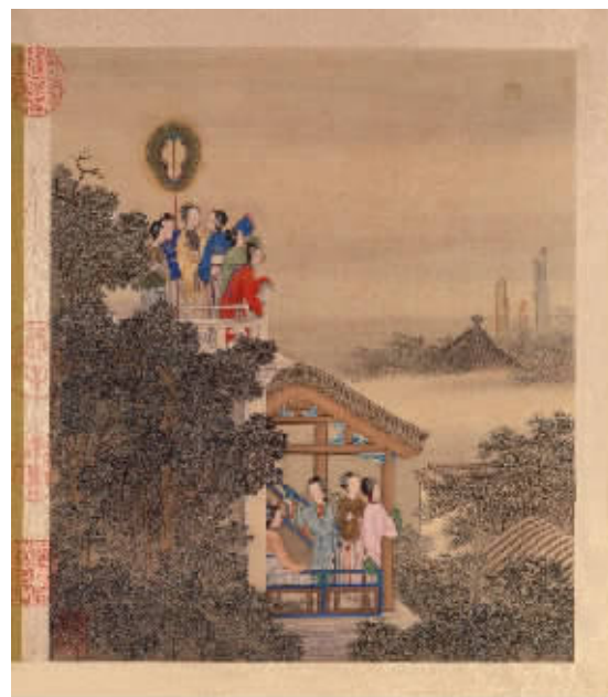
图4 清代陈枚《月曼清游图》之“琼台赏月”