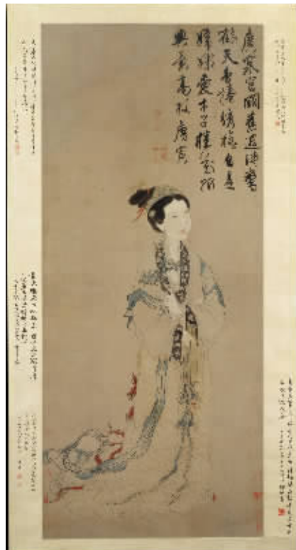
图5 明代唐伯虎《嫦娥执桂图》