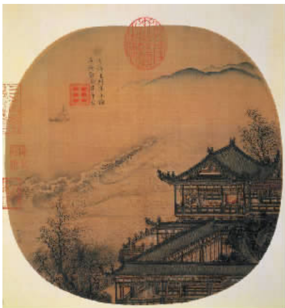
图2 南宋李嵩《月夜看潮》