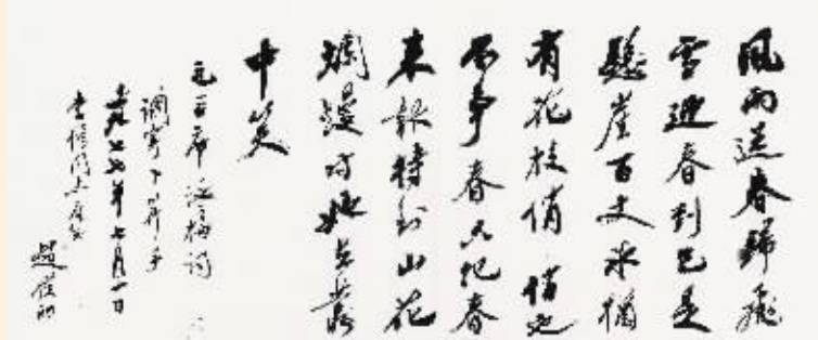
赵朴初《行书毛主席“咏梅”句》(资料图)

每年的七八九三个月,火爆的春季基本落下帷幕,而距离秋拍还有一段时间,艺术品拍卖市场迎来“静默期”。这段时间,拍卖公司要么在忙着总结,要么已经开始在为下半年的秋拍着手准备。因此,无论是对于经常在拍场“厮杀”的艺术品买家而言,还是习惯了“坐山观虎斗”的业界观察家来讲,或许会感到寂寞。显然,市场的惯常人无法左右,那么,这段时间适合做点什么呢?笔者认为有以下几点: 首先,及时从春拍中总结经验。有位经常参加拍卖的收藏家朋友不久前曾感慨,“艺术品市场需要调整,收藏家的知识和思维也需要适时地跟进和调整,如此才能与时俱进,才能时时处于有利地位。”坦率的言语中,透露着对知识和经验的推崇。事实上,任何市场都不是一成不变的,艺术品市场同样如此,而作为艺术品市场的直接参与者,收藏家无疑最具感触。不管是为了纯粹的收藏喜好,还是出于投资回报的预期,以最小的代价获取最大回报是每一位理性市场参与者的目标。中国艺术品市场春拍季,集结了全国乃至全球顶级藏家、艺术品