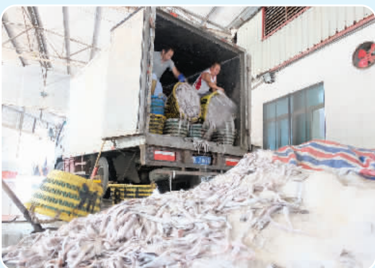
▲进货时在室外穿着短袖

有时，手被冻僵了，小黄就到外面“暖和”一下。有时，忙得停不下来，小黄只能通过搓搓手、运动给自己取暖。相对于要在冻库里工作一整天的工人来说，更多是要调整自身的身体素质来适应这种环境。小黄说：“由于温差太大，冻库工人经常感冒或中暑，下班后最安逸的事，就是喝一碗姜汤、打一次火罐。”空闲时，小黄会去打篮球、跑步以及做一些体育锻炼，确保自身的身体素质过硬，才能胜任这份冰与火的考验。（记者 李荣鑫）