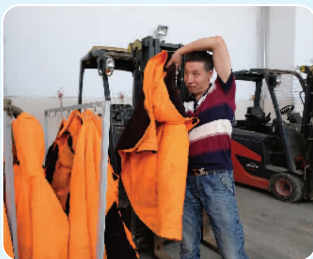
▲进冻库前一定要穿好棉袄