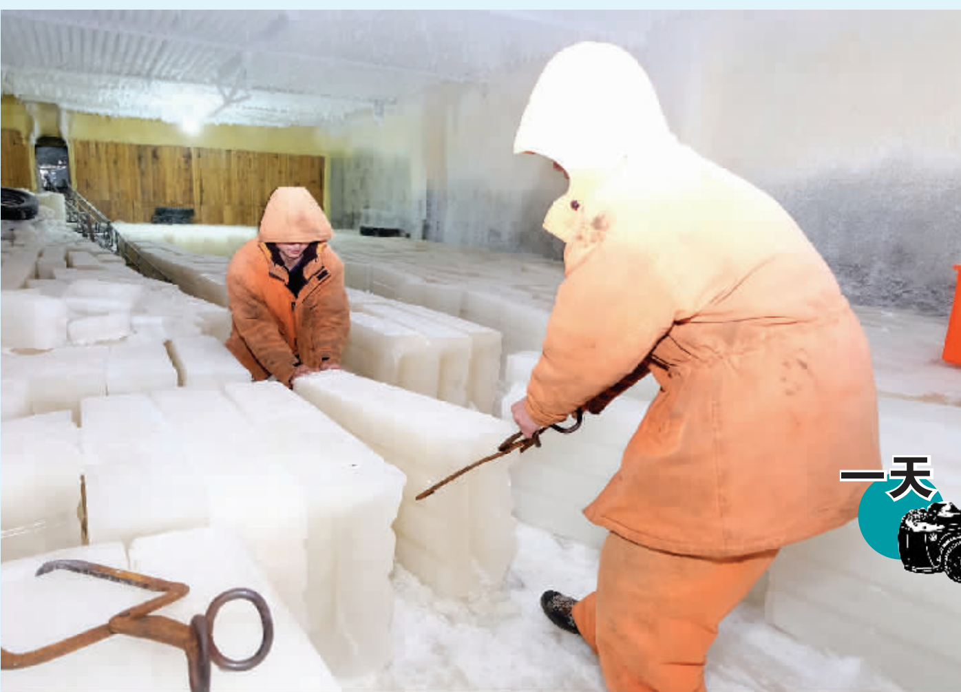
▲在“冰冻世界”里搬运冰块