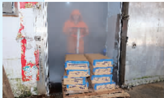
▲每天在近30℃至零下25℃之间进出上百次