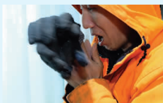
▲冷得不行了就给自己搓手取暖