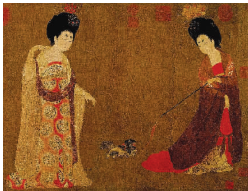
周昉《簪花仕女图》中的贵妇戏犬片段

随着上世纪90年代国内宠物热的兴起，狗越来越多地进入大众的日常生活，频频成为当代画家的表现对象。当代大家黄永玉先生的水墨画，具有讽刺与幽默的色彩，他画的狗系列画作，令人忍俊不止。画家史国良的西藏风情画中，我们也经常能看到狗的身影。古今画狗的名家名作还有很多，实难一一列举。狗的忠诚、温顺是人类的最爱，正缘于狗与人类的这种特殊关系，狗才成为画家们百画不厌的题材。（牟建平）