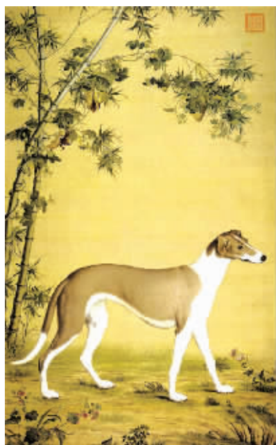
郎世宁《竹荫西羚图》