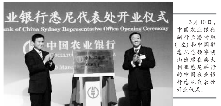
3月10日,中国农业银行副行长潘功胜(左)和中国驻悉尼总领事胡山出席在澳大利亚悉尼举行的中国农业银行悉尼代表处开业仪式。