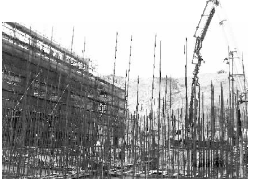
开春后,作为2010年的市重点项目,由石狮清源印染发展有限公司负责的“福建省水煤浆研发与生产应用示范基地”正加快建设进度。据了解,水煤浆厂项目计划在今年6月上旬投入运行。